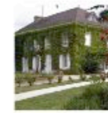
Bazoches sur Guyonne

ADRACHME (Association de Recherches Archéologiques et de Conservation Historique de Montfort et de son Environnement), ASM (Association de Sauvegarde des Mesnuls), Maurepas d'Hier et d'Aujourd'hui, La Vallée aux Chevaux, Les Amis des Bois de Maurepas Jouars-Pontchartrain et l'Histoire, SHARY (Société Historique et Archéologique de Rambouillet et de l'Yveline), Les Amis de Saulx-Marchais.